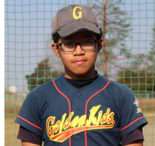
チャート・ケツマラ